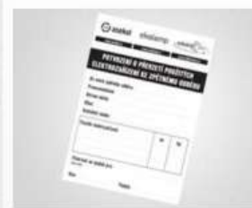
Potvrzení o převzetí použitých elektrozařízení