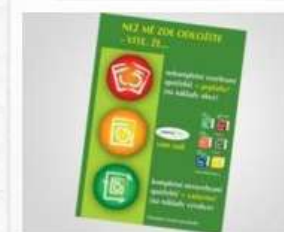
Nekompletnost - plakát A3