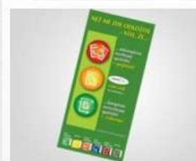
Nekompletnost - leták DL