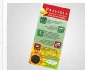
Pravidla zacházení s vysloužilými