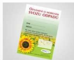
Plakát mobilní svoz (A3)