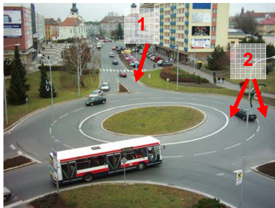
Obrázek 4: Příklad špatné dispozice okružní křižovatky. Nejenže je šířka okružního pásu naddimenzovaná, ale nebezpečný je nesoulad mezi počtem jízdních pruhů na okruhu a na výjezdech