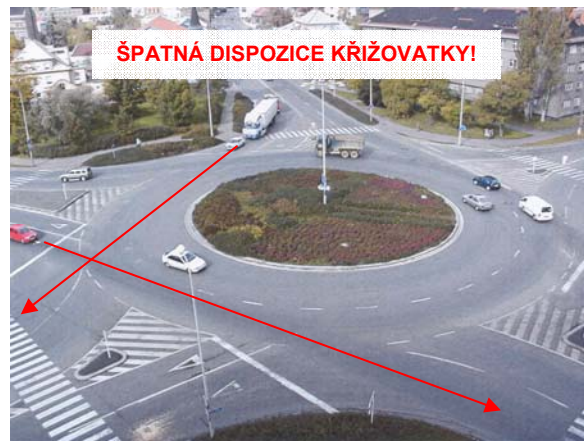
Obrázek 2: Při návrhu okružní křižovatky je nutné zabránit tangenciálním průjezdům (Kolín)