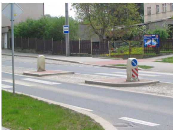
Obrázek 5: Příklad středního dělicího ostrůvku (Dobřany)