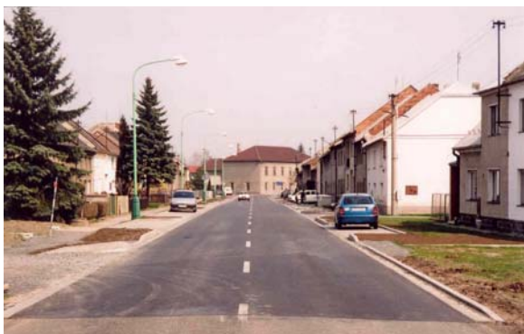
Obrázek 9: Příklad průtahu obcí (Rajhrad)