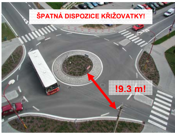
Obrázek 1: Příklad naddimenzované šířky okružního pásu, kdy šířka pojezdného prstence a šířka okružního pásu dávají dohromady zbytečně 9,3 m (Blansko).