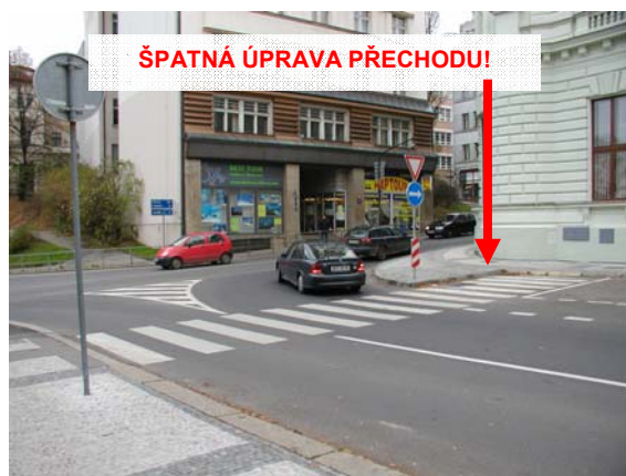
Obrázek 8: Naprosté nepochopení základního principu vysazené chodníkové plochy (Liberec)