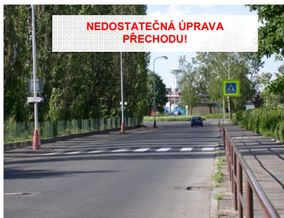
Obrázek 6: Příklad špatného řešení přechodu pro chodce (dlouhý přímý úsek řidiče svádí k vyššímu rychlostem)