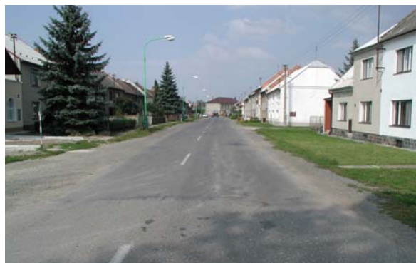
Obrázek 10: Jak průtah nemá vypadat (Rajhrad – před úpravou)