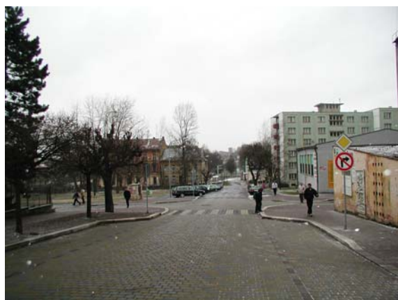
Obrázek 7: Příklad vysazené chodníkové plochy (Cheb)